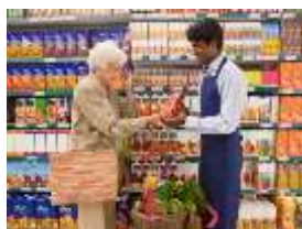
5. shop assistant