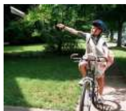
4. Paper boy