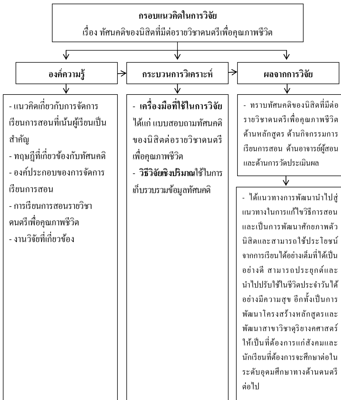
ภาพที่ 1 กรอบแนวคิดในการวิจัย