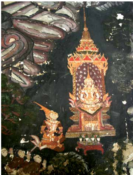
พระประธาน เป็นพระพุทธรูปปางมารวิชัย

พระอุโบสถ เป็นอาคารคอนกรีตเสริมเหล็ก ลักษณะสถาปัตยกรรมทรงไทย หลังคาลด ๒ ชั้น มุงกระเบื้อง ประดับช่อฟ้า ใบระกา ทางหงส์ ชุ่มประตุน้ำต่างเป็นลายปูนปั้นงดงาม ภายในพระอุโบสถมีภาพจิตรกรรมฝาผนังเล่าเรื่องชาดก ภาพฝาผนังเหนือหน้าต่างเป็นภาพเทพพนม พัดฉกคนธรรพ์ และเทพบันเทิง ฝาผนังหลังพระประธานเป็นภาพพระพุทธเจ้าทรงแสดงพระธรรมเทศนาโปรดพระพุทธมารดา