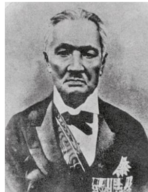
สมเด็จพระยาบรมมหาราชศรีสุริยวงศ์ (ช่วง บุนนาค)