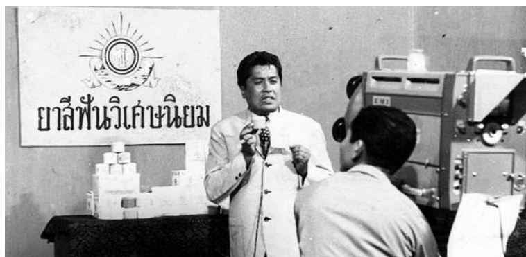
โฆษณายาสีฟันวิเศษนิยมในรายการโทรทัศน์

นำเงิน ๒๕๐,๐๐๐ บาทไปถวายวัด เสมือนว่าเป็นการซื้อด้าริเดิม และคำพูดที่เคยเอ่ยไว้กลับคืนมา