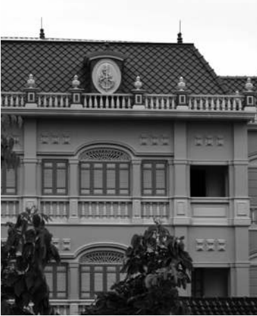
อาคารหลังใหม่ สร้างเป็นตึกฝรั่ง ๓ ชั้น ทำหลังคาทรงปั้นหย่า

เป็นคนไทยเชื้อสายลาวจังหวัดอุบลราชธานี หม่อมเจ้าตุ้มไม่มีโอรส และธิดา