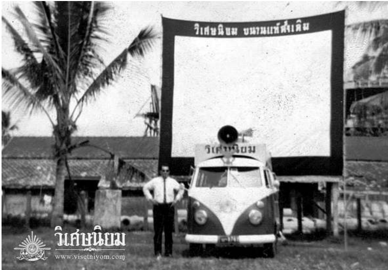
หนังขายยาสำหรับประชาสัมพันธยาเสพติดวิเศษนิยม เร่ไปยังที่ต่าง ๆ

อย่างที่กล่าวไปแล้วว่ายาเสพติดวิเศษนิยมถือเป็นสินค้า ยอดนิยมและติดตลาด ในระหว่างสงครามโลกครั้งที่ ๒ ของ ทุกอย่างขาดแคลน ญี่ปุ่นได้ซื้อยาเสพติดวิเศษนิยมส่งให้ทหาร ในกองทัพใช้ ก่อให้เกิดรายได้แก่เจ้าของอย่างมหาศาล เจ้าของ ซึ่งมีฐานะดีอยู่แล้วก็ยังมีฐานะดีขึ้นไปอีก นับเป็นคนบดีคนหนึ่ง ในย่านคลองบางหลวง คนงานหรือลูกจ้างในบ้านวิเศษนิยม ส่วนมากเป็นผู้หญิงทั้งหมด ฝูงผ้าแดงทุกคน กินอยู่กับเจ้าของ กลางคืนมีแขกยามตีระฆังบอกเวลาดังแต่ ๒ ทุ่มจนรุ่งเช้า