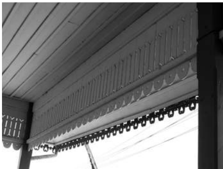
ตัวตึกเป็นอาคาร ทรงปั้นหยา ๒ ชั้น หลังคามุงกระเบื้องว่าว ชั้นบนด้านหน้าและด้านหลัง เป็นระเบียงอยู่ภายในชายคา ซึ่งเป็นไม้ฉลุลายทั้งหมด

ของสิ่งก่อสร้างดังที่กล่าวมาทั้งหมดนี้ คงรักษาไว้ได้เพียงด้านหลังเท่านั้น นอกนั้นผู้พึ่งต้องบูรณะซ่อมแซมเปลี่ยนไปตามกาลเวลา