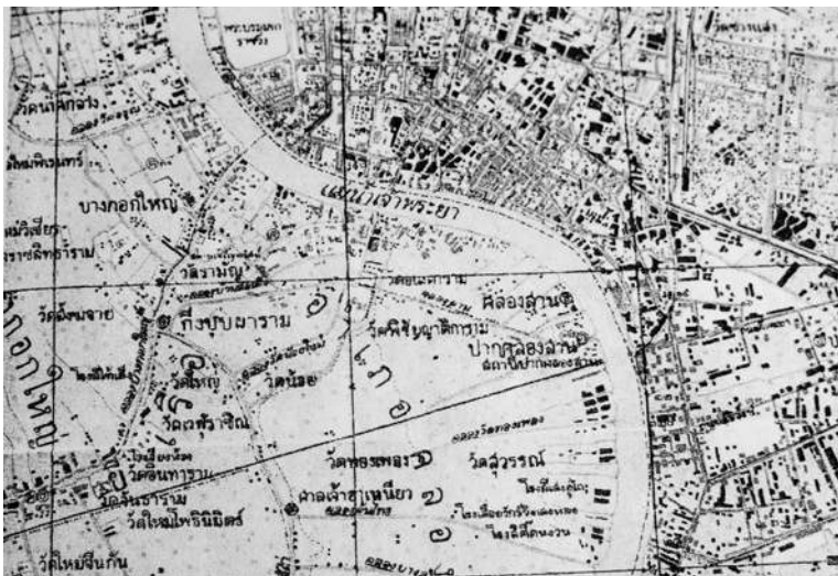
แผนที่แสดงที่ตั้งกิ่งอำเภอบุปผาราม ซึ่งเคยเป็นที่ว่าการอำเภอบางกอกใหญ่ อยู่ริมคลองบางไส้ไก่

ตึกที่ว่าการอำเภอบางกอกใหญ่หรือกิ่งอำเภอบุปผาราม ว่ากันว่าสร้างตามแบบสถาปัตยกรรมปัตตาเวีย เป็นตึกทรงบันหยาค ๒ ชั้น หลังคามุงกระเบื้องว่าวทำจากซีเมนต์ แต่เดิมน่าจะมุงกระเบื้องดินเผาอย่างกระเบื้องวัด ภายหลังมีการซ่อมแซมเปลี่ยนเป็นกระเบื้องซีเมนต์ ที่สันนิษฐานอย่างนี้ด้วยพบเศษกระเบื้องดินเผา จมอยู่รอบ ๆ ตัวตึก ตัวอาคารมีลักษณะเหมือนตัว T หางสั้น ชั้นบนมี ๓ ห้อง ชั้นล่างมี ๓ ห้อง ห้องตรงกลางใหญ่กว่าห้อง