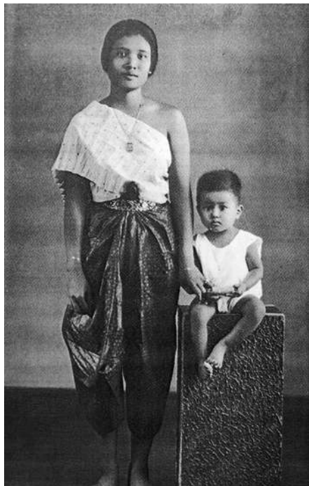
ผู้เขียนในวัยเยาว์ ถ่ายภาพร่วมกับมารดา

สภาพชำรุดทรุดโทรมมาก เป็นต้นว่าเขื่อนอิฐที่อยู่ติดกับคลอง บางหลวงและคลองบางไส้ไก่พังทลายลงน้ำ เฉพาะด้านคลอง บางไส้ไก่ที่ดินถูกน้ำเซาะพังทลายไปทั้งหมด เหลือเพียงตัวตึก และชานตึกโดยรอบเท่านั้น ไม่นานนักชานตึกก็พังลงน้ำไปอีก ต้องทำเขื่อนไม้กั้นดินพอประทังไม่ให้พังต่อไป แต่ภายหลังเขื่อนไม้ ก็พังลงอีก น้ำเซาะจนเห็นฐานรากของอาคาร ส่วนเขื่อนอิฐด้าน คลองบางหลวงบางส่วนพังลงน้ำไป ส่วนที่คงเหลืออยู่ก็ใช้การ ะไรไม่ได้ พื้นดินตรงนี้ยังพอเหลืออยู่บ้างเล็กน้อย ใช้ปลูกไม้ดอก และผักสวนครัว ทางเดินจากตัวตึกลงสู่ที่น้ำยังพอเหลืออยู่