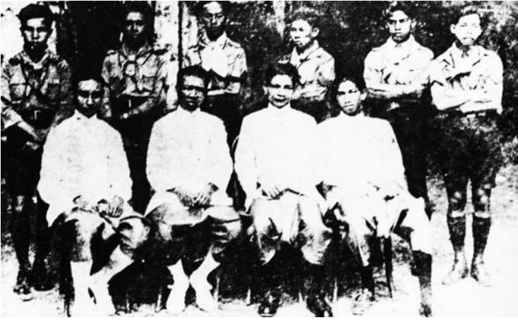
คณะครูและนักเรียนวิชาลูกเสือของโรงเรียนฝึกหัดครู ในขณะที่เปิดสอนเป็นแผนกหนึ่งคู่กับ โรงเรียนมัธยมบ้านสมเด็จเจ้าพระยา ในปี พ.ศ. ๒๕๐๐

โรงเรียนนอก คือบริเวณที่เคยเป็นโรงเรียนศึกษานารีมาก่อน ปัจจุบันคือบริเวณมหาวิทยาลัยราชภัฏบ้านสมเด็จเจ้าพระยา โรงเรียนศึกษานารีที่ตั้งอยู่ ณ ที่แห่งนี้ ในสมัยก่อนนั้นมีลักษณะอย่างไรบอกไม่ได้ เพราะไม่เคยเห็น เคยเห็นแต่เมื่อครั้งเป็นโรงเรียนบ้านสมเด็จเจ้าพระยาแล้ว สิ่งก่อสร้างที่ดูมั่นคงมีเฉพาะตึก ๓ ชั้นหลังเดียว ชั้นล่างใช้เป็นสำนักงานและที่พักครูของโรงเรียน ส่วนชั้นที่ ๒ และชั้นที่ ๓ ใช้เป็นที่เล่าเรียนของนักเรียนชั้นมัธยมศึกษาตอนปลายปีที่ ๕-๖