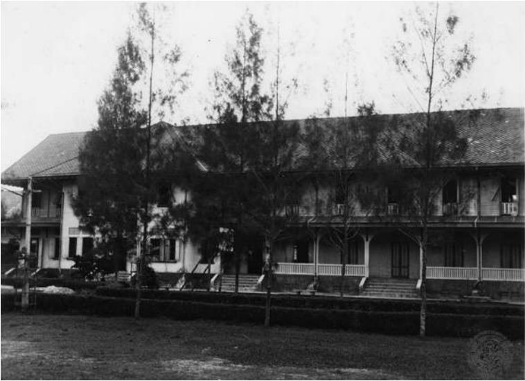
“คณะพิเศษกุฎี” ชื่อเรียกกลุ่มอาคารหอนอนนักเรียน-นักศึกษา สร้างขึ้นตั้งแต่เมื่อครั้งขยายพื้นที่โรงเรียนออกไป ภาพถ่ายเมื่อปี พ.ศ. ๒๔๗๔