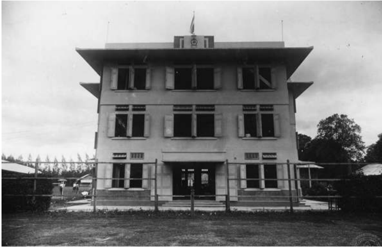
ตึก ๑ ที่เป็นห้องเรียนหลังแรกของโรงเรียนมัธยมบ้านสมเด็จพระยา เมื่อย้ายมาตั้งบนที่ดินของท่านผู้หญิงพัน ปัจจุบันถูกทุบทิ้ง สร้างอาคารใหม่ขึ้นทดแทน ภาพถ่ายเมื่อปี พ.ศ. ๒๔๗๘

หลังคาของตึกหลังนี้เป็นดาดฟ้า มีกำแพงโดยรอบ ด้าน หน้ามีตราของโรงเรียนเรียกว่า ตราสุริยะ เป็นรูปใบเสมา มี ศาสนสุภาษิตเขียนไว้ว่า สัจจะ อมตตา วาจา แปลว่าความจริง เป็นสิ่งไม่ตาย เมื่อโรงเรียนเปลี่ยนฐานะจากโรงเรียนระดับมัธยม ศึกษาเป็นมหาวิทยาลัย จึงมีตึกหลายหลังเกิดขึ้นในบริเวณนี้ ตึก เก่าแก่หลังนี้ที่ภายหลังเรียกว่า ตึก ๑ ได้ถูกรื้อทิ้งไป