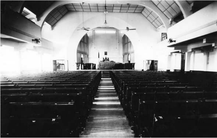
ภายในหอประชุมศรีสุริยวงศ์ ซึ่งเวลานั้นถือเป็นอาคารที่ทันสมัยมาก ภาพถ่ายเมื่อปี พ.ศ. ๒๔๗๙

ด้วยไม้เรียว เพราะโตเป็นหนุ่มแล้วทุกคน จึงใช้วิธีให้พวกเพื่อน ๆ จับโยนสระ ถือเป็นเรื่องอับอายของนักเรียนในสมัยนั้น ต่อมาสระน้ำตรงนี้ได้พัฒนาเป็นสระว่ายน้ำทันสมัยให้เด็ก ๆ มาฝึกเรียนว่ายน้ำ