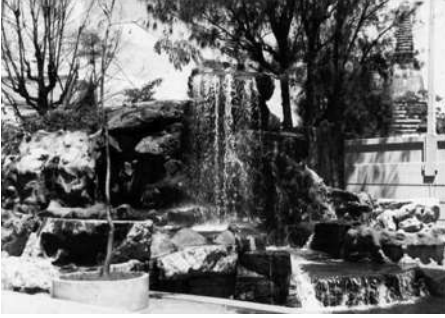
น้ำตกหน้าภัตตาคาร สวนกุหลาบข้างสะพานพุทธ แถวทางเข้าตรอกพญาไม้

ผิวเผินและไม่คิดอะไร ก็คงเห็นเจตนาดีของเขตคลองสาน หากมองให้ลึกลงไปก็จะเห็นความไม่เข้าท่าแฝงอยู่อย่างรู้เท่าไม่ถึงการณ์ กล่าวคือ