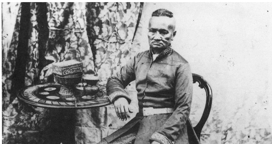
สมเด็จพระเจ้าพระยาบรมมหาศรีสุริยวงศ์ (ช่วง บุนนาค)

ขณะที่รัชกาลที่ 4 กำลังประชวร บ้านเมืองก็เกิดความวุ่นวายพร้อมๆ กันหลายประการ หนึ่งในเรื่องกงสุลอังกฤษไม่พอใจรัฐบาลสยามที่ไม่ปฏิบัติตามหนังสือสัญญา ถึงกับ “ลดธง” เพื่อแสดงเจตนา “ตัดทางพระราชไมตรี” หนึ่งใน คือ เกิดเรื่อง “เงินปลอม” แพร่หลายในการค้าขายของพระนคร จนบรรดาร้านค้าต่างๆ เกิดความกังวลถึงกับจะปิดตลาดไม่ค้าขาย เพื่อแก้ปัญหาเฉพาะหน้า หนึ่งใน คือ เกิดปัญหาโจรผู้ร้ายชุกชุม และพวกอั้งยี่ ฯลฯ ขณะที่ สมเด็จพระเจ้าพระยาบรมมหาศรีสุริยวงศ์ (ช่วง บุนนาค) หรือ “สมเด็จพระช่วง” เวลานั้น เป็นสมุหกลาโหมต่อจากบิดา และมีรากฐานอำนาจตระกูล “บุนนาค” ที่ญาติพี่น้องเป็นขุนนางตำแหน่งสำคัญมาอย่างต่อเนื่อง