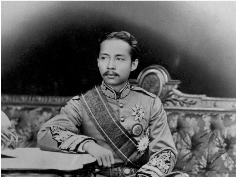
พระบาทสมเด็จพระจุลจอมเกล้าเจ้าอยู่หัว รัชกาลที่ 5

หนังสือพิมพ์จากฝรั่งเศสอายุเก่าแก่ถึง 147 ปี แจ้งข่าวความคืบหน้าการปลดแผ่นดินในประเทศสยามเมื่อปี ค.ศ. 1868 ว่ากษัตริย์องค์ใหม่ผู้เยาว์วัยได้รับการแต่งตั้งโดยหัวหน้าขุนนางจากตระกูลที่ทรงอำนาจที่สุดให้สืบทอดราชวงศ์และจะเป็นผู้หนุนหลังรัชกาลใหม่ในฐานะผู้สำเร็จราชการแผ่นดิน ทว่า กษัตริย์องค์ใหม่กลับโต้แย้งว่าทรงถูกเบียดบังอำนาจและเหล่าขุนนางถูกรอบงำโดยผู้สำเร็จราชการคนนี้ แล้วใครกันแน่ที่อยู่ข้างหลังบัลลังก์เมื่อเริ่มต้นรัชกาลที่ 5? ท่ามกลางความผันผวนและเปลี่ยนตัวผู้นำประเทศ บุรุษอีกคนหนึ่งต่างหากที่เป็นแกนขาและดวงตาของกษัตริย์อย่างแท้จริง ในฐานะผู้สำเร็จราชการคนที่ 2 คนภายนอกประเทศผู้อ่านข่าวหนังสือพิมพ์ฝรั่งเศสมักจะเข้าใจอย่างผิดเพี้ยนถึงความเปลี่ยนแปลงในสยามช่วงปี ค.ศ. 1868 (พ.ศ. 2411) ภายหลังจากเสด็จสวรรคตของพระบาทสมเด็จพระจอมเกล้าเจ้าอยู่หัว รัชกาลที่ 4 จากข่าวลือที่เล็ดลอดออกไปเท่านั้น เพราะในสมัยนั้นยังไม่มีผู้สื่อข่าวและสำนักข่าวต่างประเทศเป็นตัวเป็นตนอยู่ในพระนคร ส่วนในพระนครเองคนวงในก็ยังเชื่อถือแนวโน้มทางการเมืองที่ขุนนางจากครอบครัวตระกูลขุนนางยังคงมีบทบาทต่อไปภายในราชสำนักและเป็นกลุ่มผู้ให้ข่าวต่อสังคมภายนอกที่มีความเป็นไปได้มากที่สุด สถานการณ์ในระยะนั้นจึงน่าเชื่อถือว่าไม่มีทาง “พลิกโฉม” ที่เจ้าพระยาศรีสุริยวงศ์ (ช่วง บุนนาค) จะเป็นประธานหลักในการสรรหาพระเจ้าแผ่นดินองค์ใหม่ในที่สุด